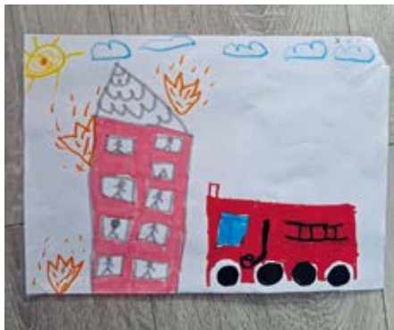
➤ Giulia : Grande section maternelle de Niffer

Dans le contexte des portes ouvertes, un concours de dessin a été organisé au sein des écoles des deux villages et chacun des visiteurs présents aux portes ouvertes a pu voter pour son dessin favori. Les grands gagnants du concours sont :