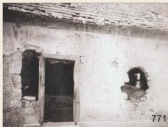
➤ Dégâts occasionnés par les tirs des chars français en novembre 1944