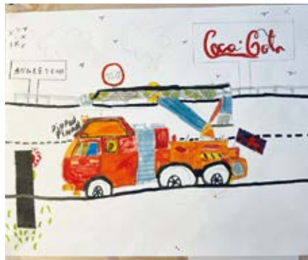
➤ Lina : CE1 Petit-Landau