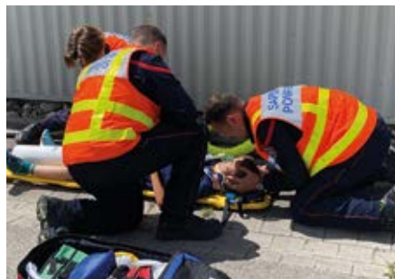
➤ Démonstration d'accident sur la voie publique

Un grand merci à vous d'être venus si nombreux lors de cette journée, votre soutien est précieux pour les pompiers de nos deux communes.