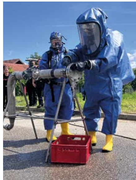
➤ Démonstration de fuite chimique sur conduite